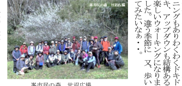
峯市民の森 甘沼広場

思わず鼻歌が出そうな良い天気、散歩途中のひ孫みたいな坊やとハイタッチ。気持ちよく峯市民の森入り口まで行くに非常にも通行止めのお知らせ。アアア神様、仏様でも大丈夫、すぐに入口を発見、無事「善止山休憩所」へたどり着きました。甘沼広場では立派な梅(写真)が笑顔で我々