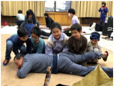
この「大人おせんべい」重たいね

か。「ついでにやるのが回目で、最初はなれなかったけど、滑っているうちにどんどん滑れるようになって、すごく面白くて楽しかった。明日もどんどん滑りたくなってきました。今日は雨が降ってしまっただけで悲しくありません。とにかく楽しく滑れました。」 ●雨、風、2日目の天気はとっても残念。でも徐々にサンバレーまで遠征していき、景色は次回のお楽しみに。