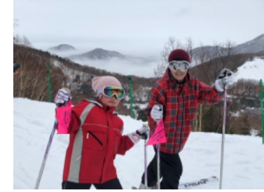
スキー教室も楽し

初日、2日目と雨。初日は午後の雪上運動会を順延にせざるを得ませんでした。 2日目は全教室ともグレンデツアーを敢行しましたが、サンバレーまでたどり着いたのは2教室のみ。雨に濡れたウェアと体に暖をとりにながらゆつたりとしたツアーとなりました。また、リフト、ゴンドラは風雨のため運行休止となり、一ノ瀬まで戻るのが大変でした。