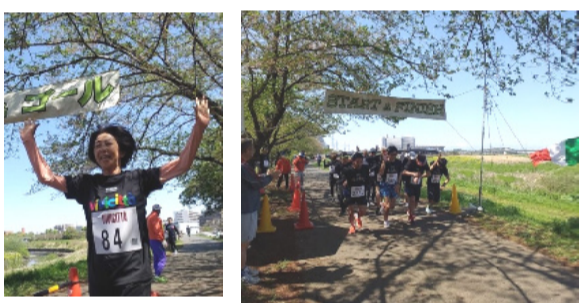
ビビチッタ！ゴール 10kmの部スタート「ビビチッタ！」