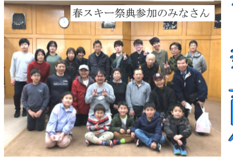
春スキー祭典参加のみなさん

3月24日夜、27日、志賀高原中央グレンデリアを会場に第48回春スキー祭典が開催されました。 コロナ禍から3年、スキー祭典の参加者の少なさもあり、参加者がそろつかどうか心配でしたが、一般参加者30名、指導員9名合わせて39名となり、満杯とはいきませんが、戻ってきた参加者で、充実の体制が実現しました。