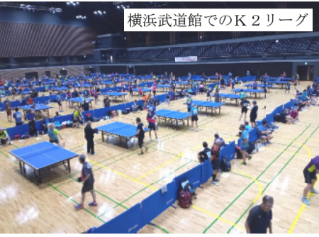
横浜武道館でのK2リーグ

2023年度の神奈川卓球協議会は、コロナ前の登録を越す多くの新規登録者を迎えて、4月5日の平塚と12日の横浜武道館でのK2リーグから始まりました。