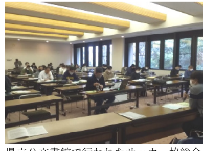
県立公文書館で行われたサッカー協議会