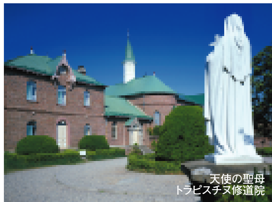
天使の聖母 トラピスト大修道院

函館開港150周年という節目の今年、教皇大使アルベルト・ボッターリ・デ・カステッロ大司教が北の大地で育まれた信仰の場を訪問されます。世界三大夜景のひとつ函館の夜景、秋の道南風景に心癒され、大自然の息吹の中で荘厳なグレゴリオ聖歌を歌う、祈りの旅へ。旅のハイライト、トラピスト大修道院では教皇大使様司式のラテン語ミサ。この機会に恵み豊かな北海道を巡礼いたしましょう。