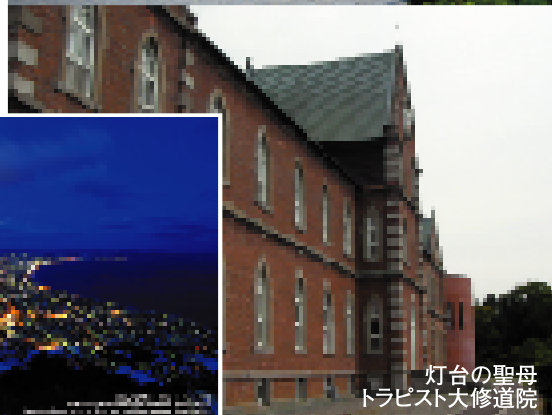
灯台の聖母 トラピスト大修道院